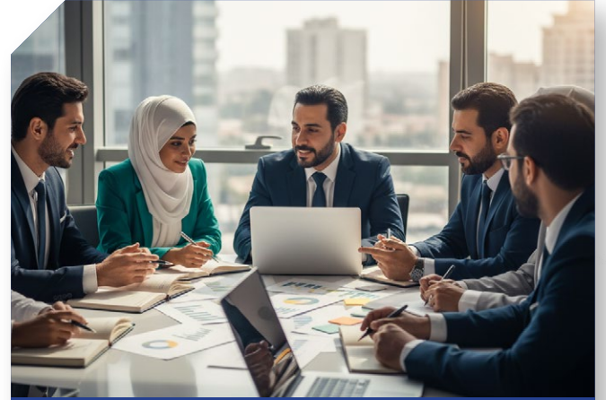
العاملين في الأقسام المختلفة

الخريجين الجدد الحاصلين على درجة البكالوريوس أو ما يعادلها.