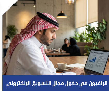
الراغبون في دخول مجال التسويق الإلكتروني

تمنحك المهارات اللازمة لتحقيق دخل إضافي من خلال تقديم خدمات تسويقية عبر الإنترنت.