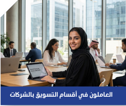
العاملون في أقسام التسويق بالشركات

تؤهلك لتطوير أدائك المهني وزيادة فعالية حملاتك التسويقية.