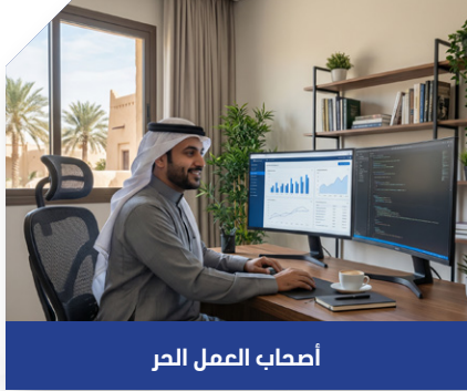
أصحاب العمل الحر

تساعدك في تسويق منتجاتك وخدماتك على الإنترنت لزيادة الانتشار والمبيعات.