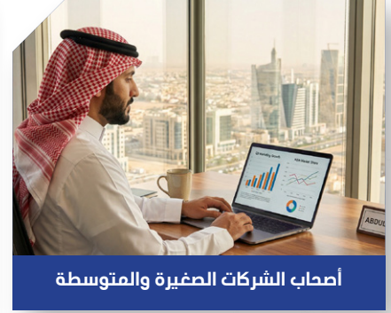
أصحاب الشركات الصغيرة والمتوسطة

تزودك بالأسس الصحيحة لبناء مشروعك الخاص وتسويقه إلكترونياً بنجاح.